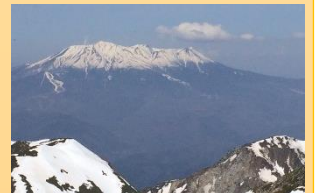
木曽駒ヶ岳から見た御岳山

最初はロープウェイやケーブルなどで上がり周辺を散歩するようなところから始めました。体力ももどり最近では韓国最高峰・漢拏山(はるらさん)や富士山、木曽駒ヶ岳、日光白根山、谷川岳、丹沢や奥多摩の山々などに出かけて自然を満喫(と反省会と称してのビールも!) 去年は15座でしたので今年は20座登頂が目標です。たもんじ交流農園や＜ハイキング＞でおおいに汗をかいて元気に過ごしたいと思っています。畑作の後の反省会もOKです。皆さまよろしくお願ひいたします!!