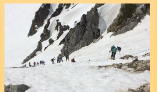
5月の木曽駒ヶ岳へ