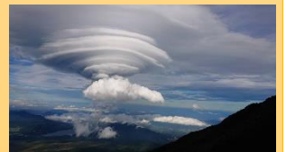
富士山から見た笠雲