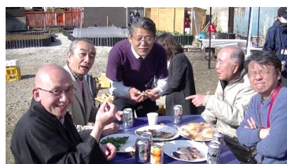
その時は存分に楽しみましょう!!

新型コロナウイルスの感染拡大への対処を寺島・玉ノ井まちづくり協議会の中で検討しました結果、3/29(日)に予定していた「オープニングセレモニー&ピザ焼きパーティー」につきましては安全が確認できる時期まで延期とさせて頂きたくことと致しました。楽しみにして頂いた皆様には誠に申し訳ございません。今しばらく不要不急の人との接触は避け、開催可能となった暁には盛大にこのイベントを開催し、みんなで心から楽しもうではありませんか。ご理解頂きますようよろしくお願いいたします。尚、種まきや水かけ等、日々の農園活動を制限するものではありません。農園はいつでも開放しております。